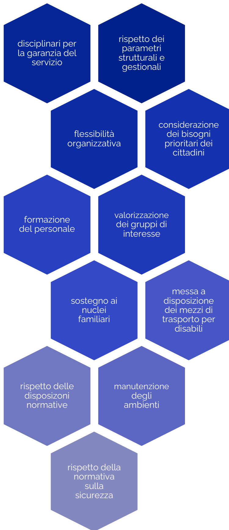
Figura 1 Obiettivi di qualità perseguiti dal settore